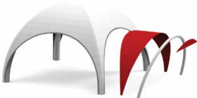
Daszek i przyłbica