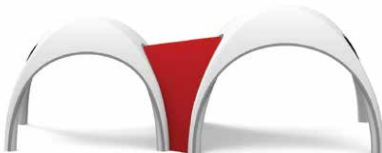
Tunel łączący pasujący do wszystkich rozmiarów