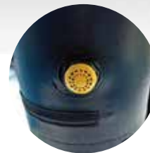
Nie wymaga stałego zasilania elektrycznego