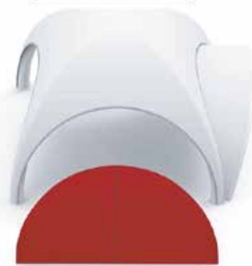
Ściana z zamkiem błyskawicznym