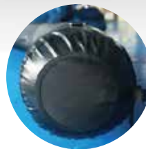
Podstawa wzmocniona PVC